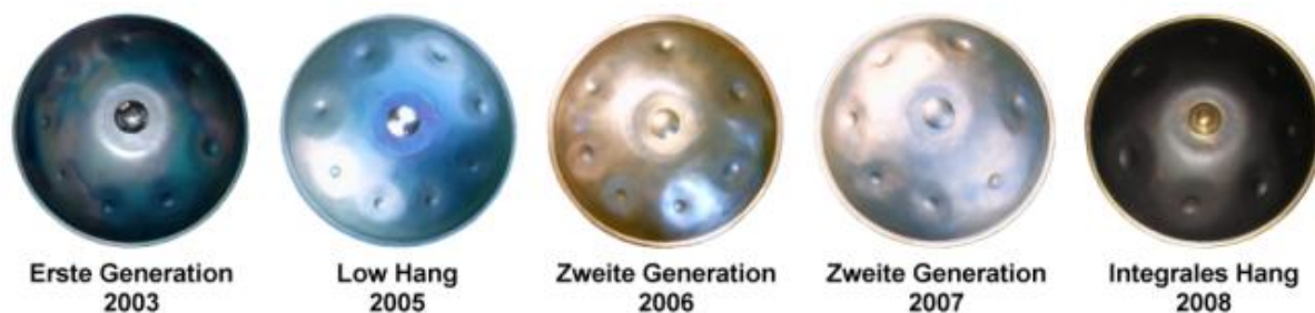
Рисунок 3. "Эволюция" ханга

Всем нам известно: звук — это волна, и всё, что окружает нас, наполнено вибрациями. Ещё в древности врачи Тибета, Индии и Китая заметили, что звук на разных частотах способен воздействовать на наш организм совершенно по-разному. Например, в Индии существует система соответствия конкретных звуков определенным энергетическим центрам человека (чакрам 1 ), позволяя гармонизировать работу того или иного органа. В качестве целительных инструментов, как правило, использовались гонг и поющие чаши, изначально предназначавшиеся для шаманских практик. В Тибете широкое распространение получил звуковой массаж: брали несколько чаш разных размеров и выстраивали их в зависимости от расположения энергетических центров — либо около тела, либо прямо на теле человека. Такая практика существует и в наше время по всему миру, пользуясь неизменной популярностью. Ханг, унаследовавший звук и традиции древних инструментов, оказывает не менее сильное воздействие на организм человека. Благодаря тому, что звук извлекается более мягко, мелодично и из всего корпуса, вибрации, передающиеся телу, распространяются по всему телу более комплексно. Мы видим, что ханг вполне способен стать современным дополнением проверенным временем целительным практикам.