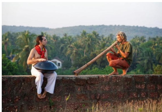
Рисунок 4 Любительский дуэт

В основном, это люди, которые, с одной стороны, любят музыку, занимаются духовным развитием, но, с другой стороны, все те кто желает отдохнуть после тяжелых рабочих будней, погрузиться в умиротворяющую атмосферу, найти «отдушину», попробовать что-то новое.