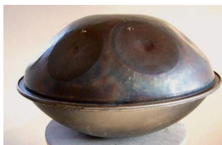
Рисунок 2.Первый прототип ханга

Вот как выглядела первая модель ханга 2000 года.